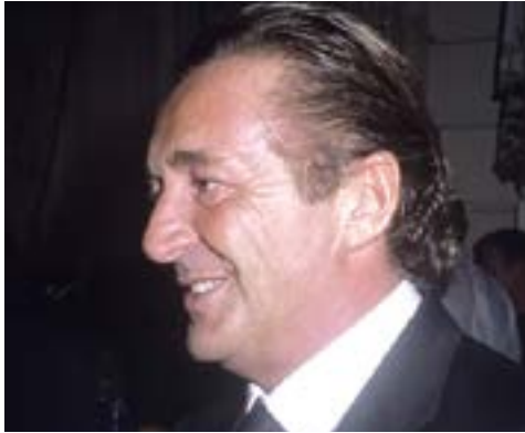
Figure 1 Gérald Marie in 2006

We are curious about your situation: are you insured? If not: do you want to be? And what would you be willing to pay? This month we are asking these questions on our socials, so please let us know!